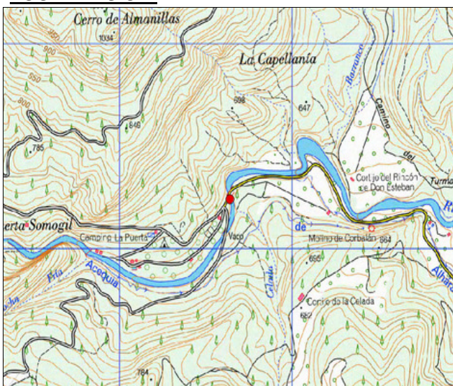
Mapa de situación