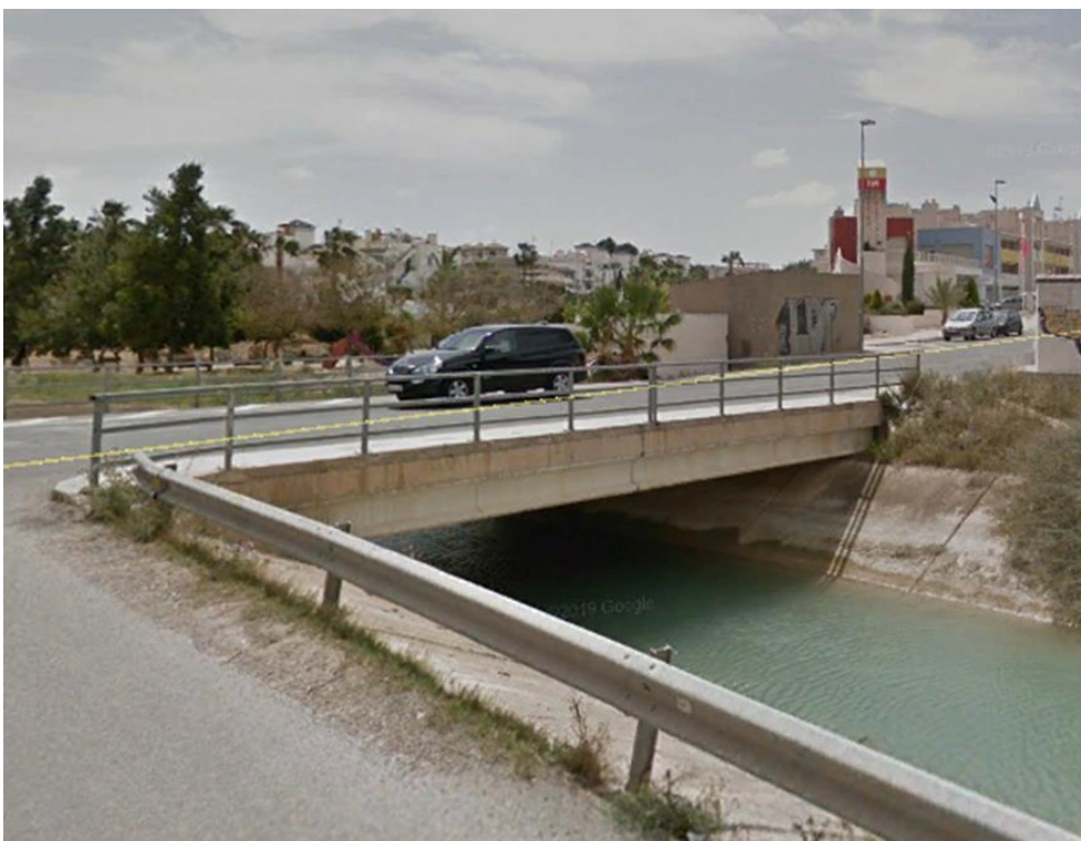
Punto de control CCC-002.

Observaciones: Buen acceso al punto de control, a través del camino de servicio del Canal del Trasvase.