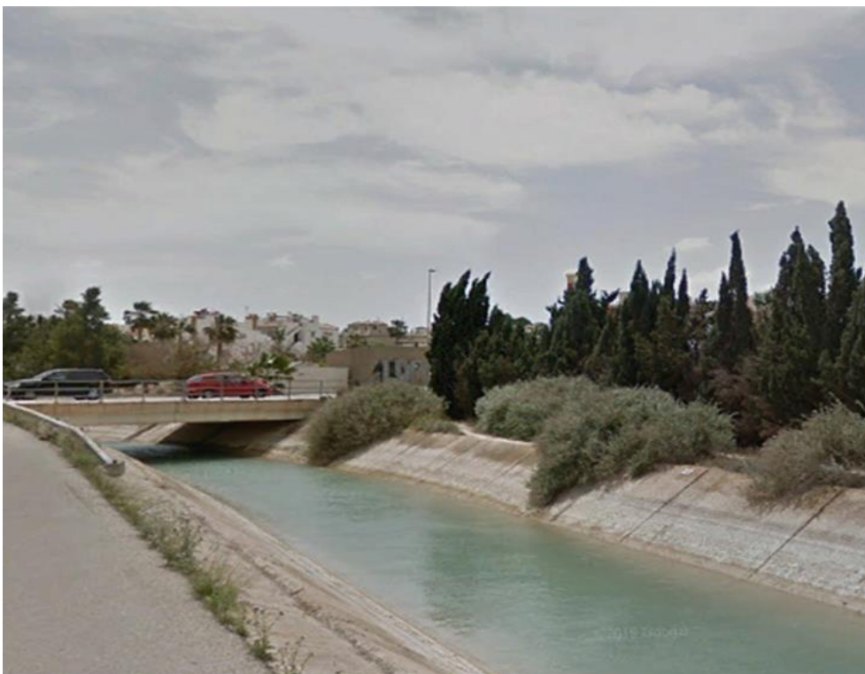
Entorno del punto de control CCC-002. A la derecha se observa el pk-16,5 en el talud del Canal.