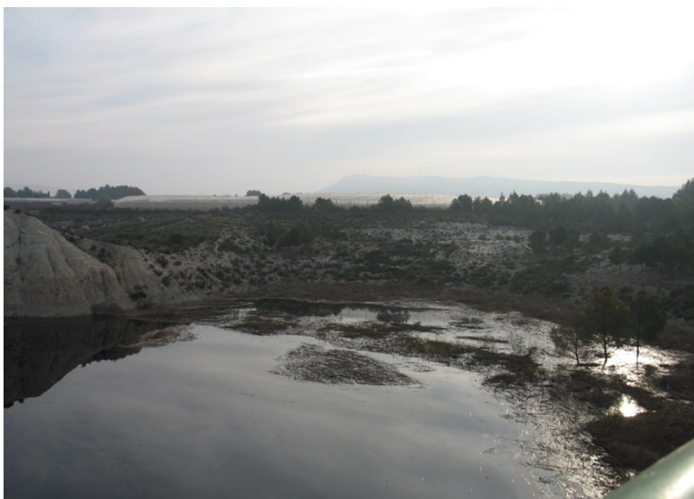
Punto de control EJU1.

Observaciones: En el momento de la visita se observaban aún los efectos de las últimas lluvias. Contactar antes con el personal encargado del embalse para el acceso al mismo.