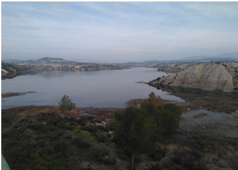
Entorno del punto de control EJU1.