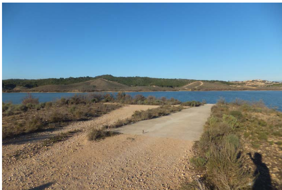
Foto del entorno