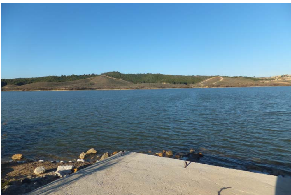
Foto del punto de muestreo