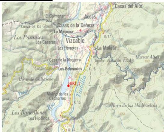
Mapa de situación