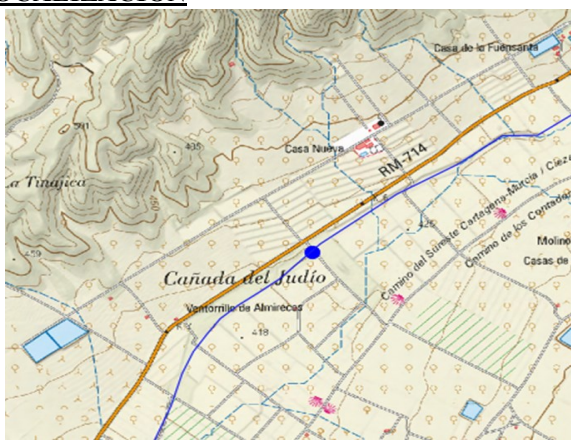
Mapa de situación