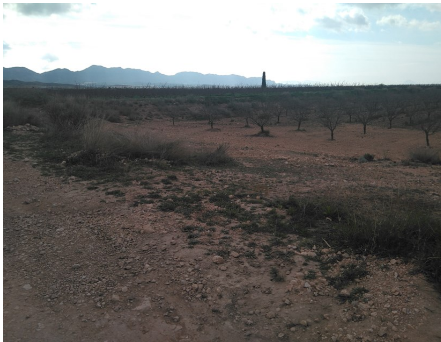
Entorno del punto de control JAP1. Se observa el cauce invadido.