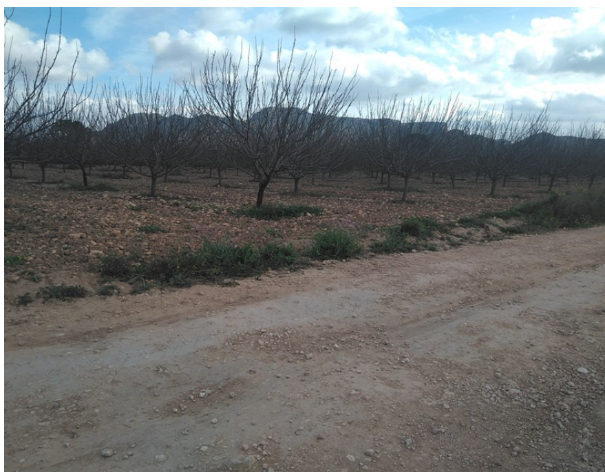
Aguas arriba del punto de control JAP1. Cultivo de frutales.

Observaciones: Baja desde el 29/04/2016 por falta de agua. Esta masa de agua se controla con el punto JUD1.