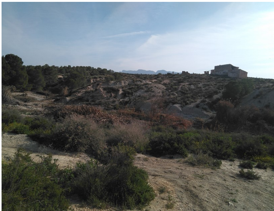
Entorno del punto de control JUD1.