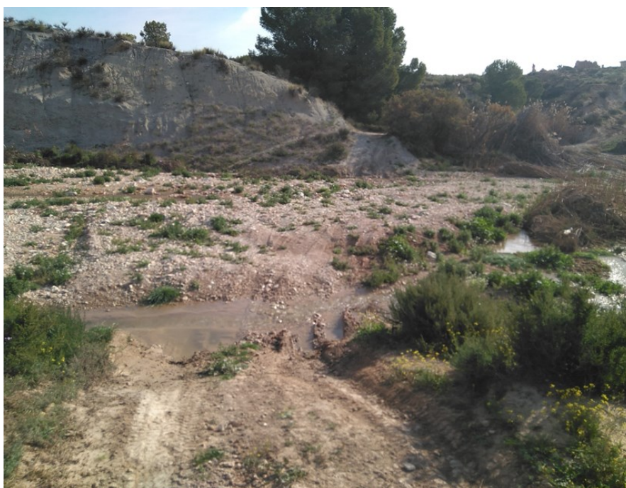
Punto de control JUD1.

Observaciones: Sustituye a JAP1, por falta de agua. Se recomienda un vehículo todoterreno. El último tramo resulta inaccesible, sobre todo, si ha llovido recientemente.