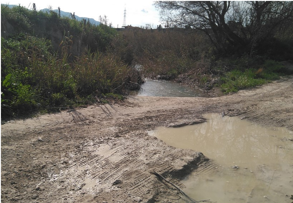
Punto de control JUD4.

Observaciones: En los alrededores del punto de control se podían observar los efectos de las últimas lluvias.