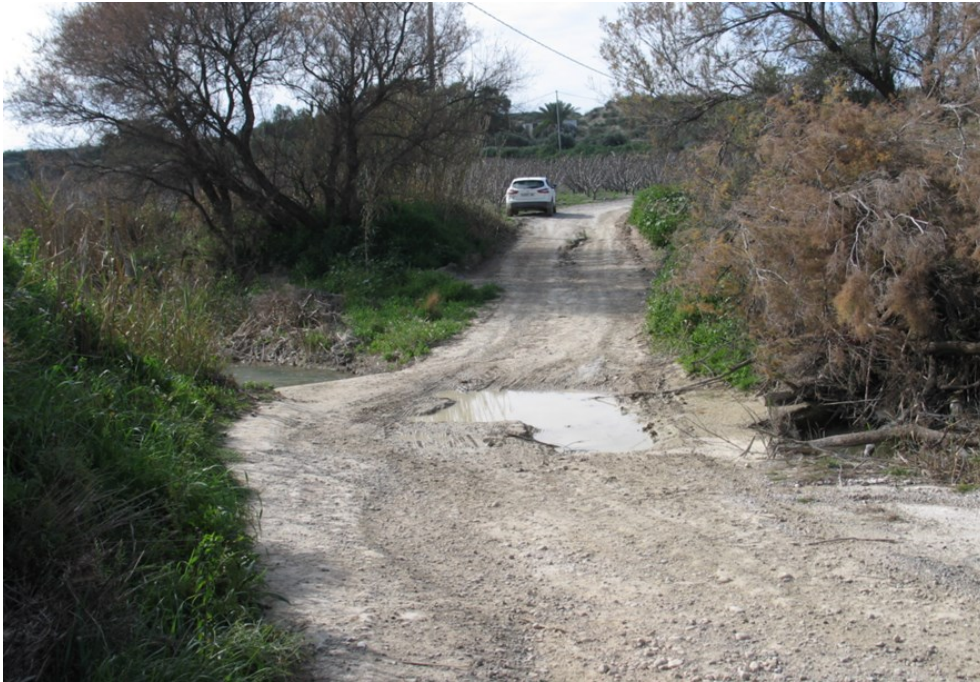
Entorno del punto de control JUD4.