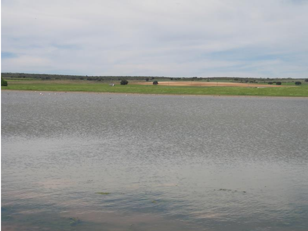
Entorno del punto de control LCRW.