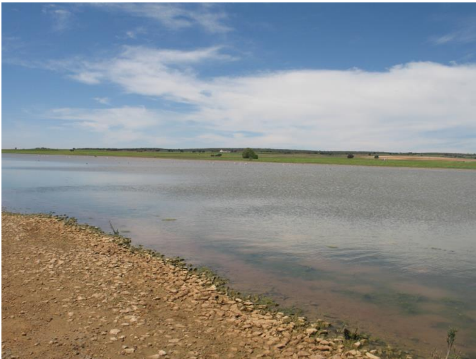
Punto de control LCRW.