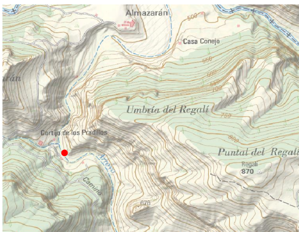
Mapa de situación