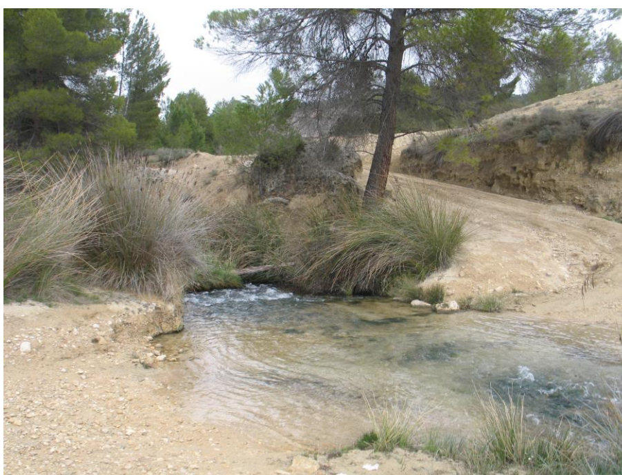
Foto del punto de muestreo