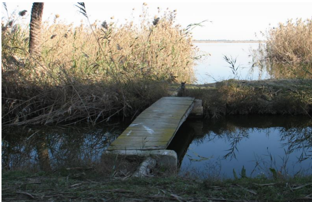
Puente de madera que cruza el canal hasta el punto de control LHLEV-1, situado en la laguna.