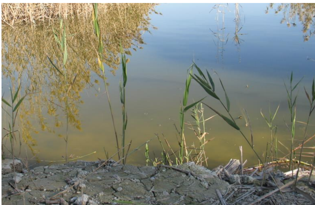
Punto de control LHOLEV_1.

Observaciones: Buen acceso al punto de control.