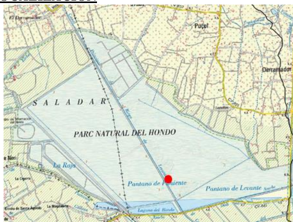
Mapa de situación