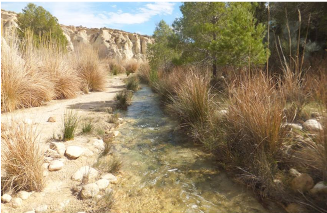
Foto del punto de muestreo

Observaciones: Acceso al cauce por el margen izquierdo.