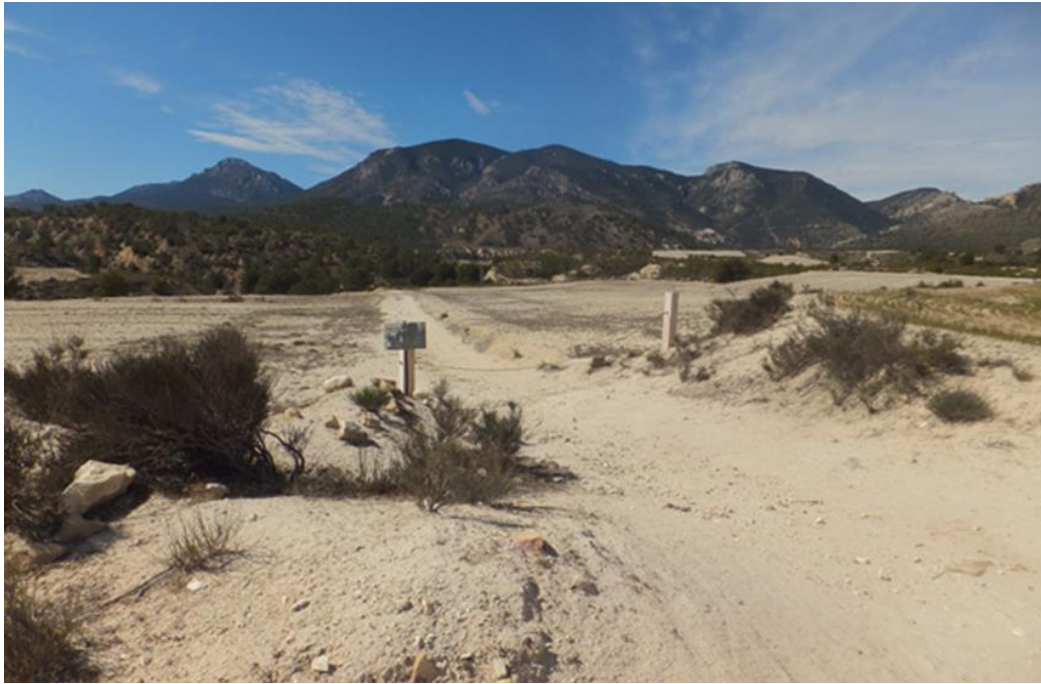
Foto del entorno