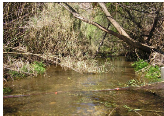
Foto del entorno