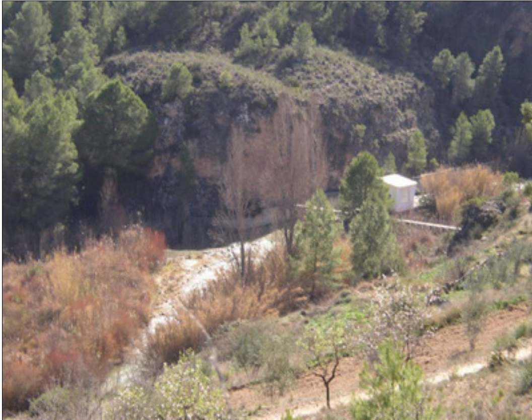
Foto del entorno