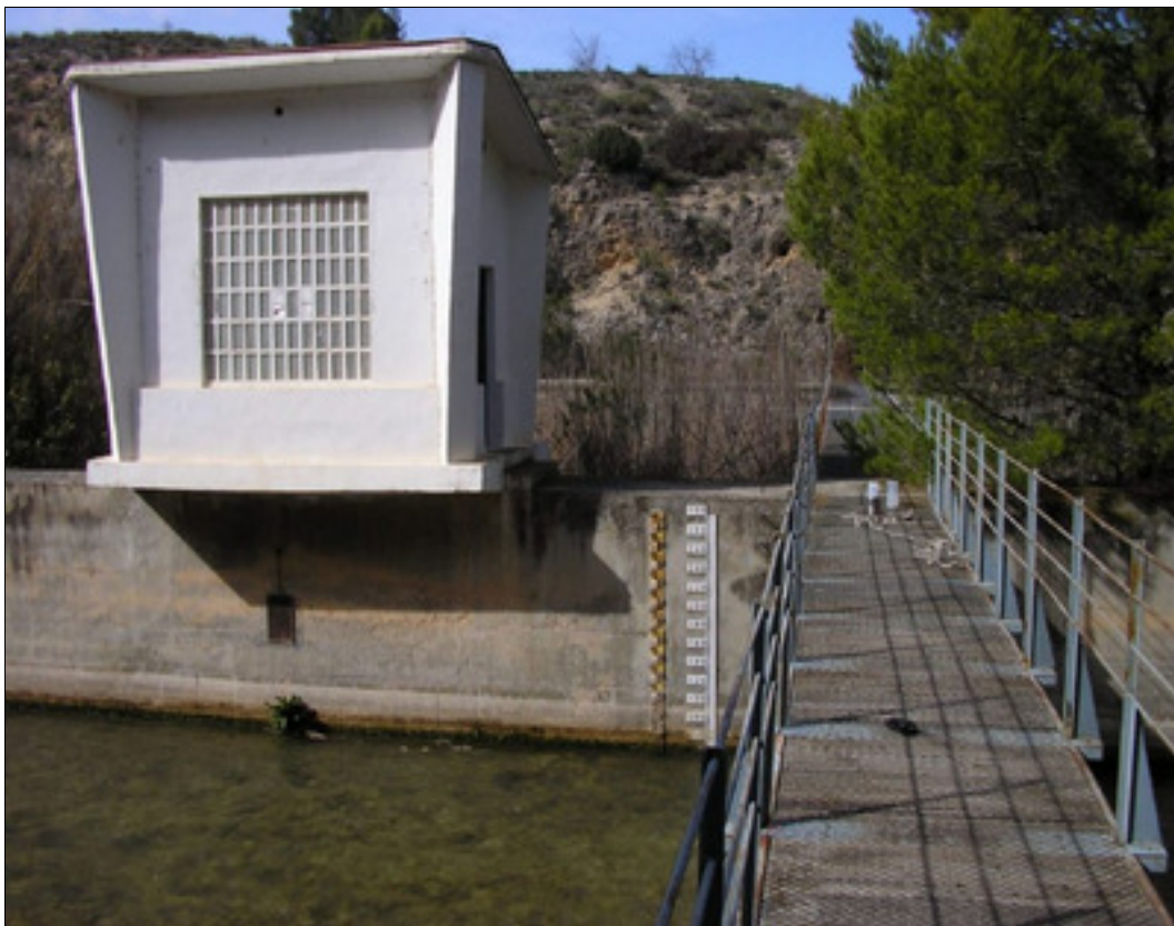
Foto del punto de muestreo