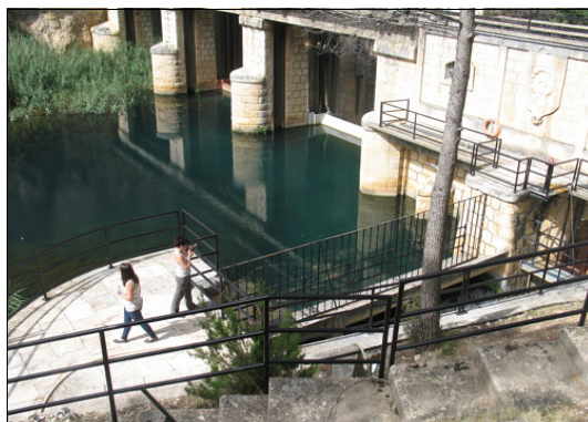
Foto del punto de muestreo