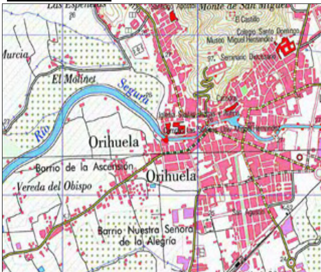
Mapa de situación