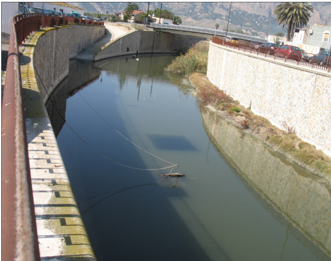
Foto del punto de muestreo