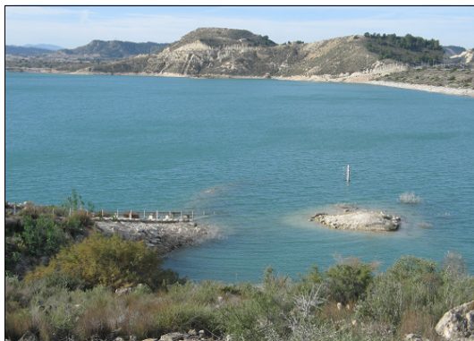
Foto del punto de muestreo