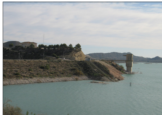
Foto del entorno