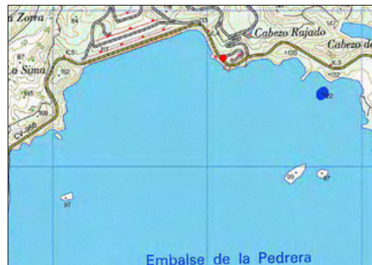
Mapa de situación