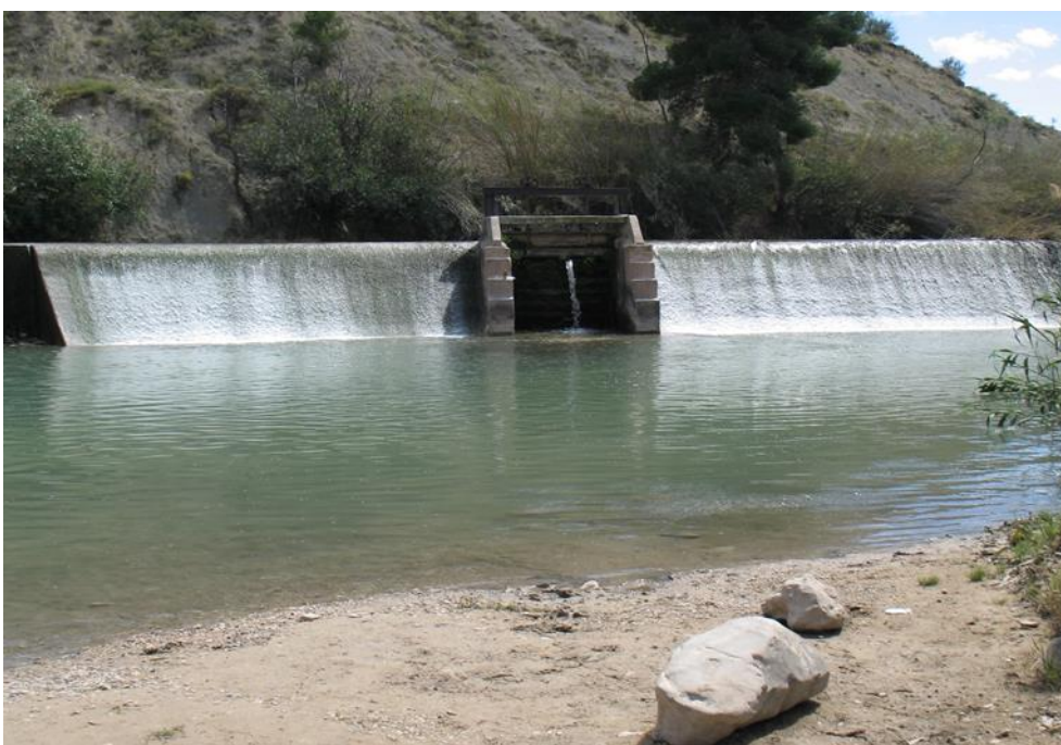
Punto de control.

Observaciones: El punto de control se encuentra en la playa fluvial El Jarral.