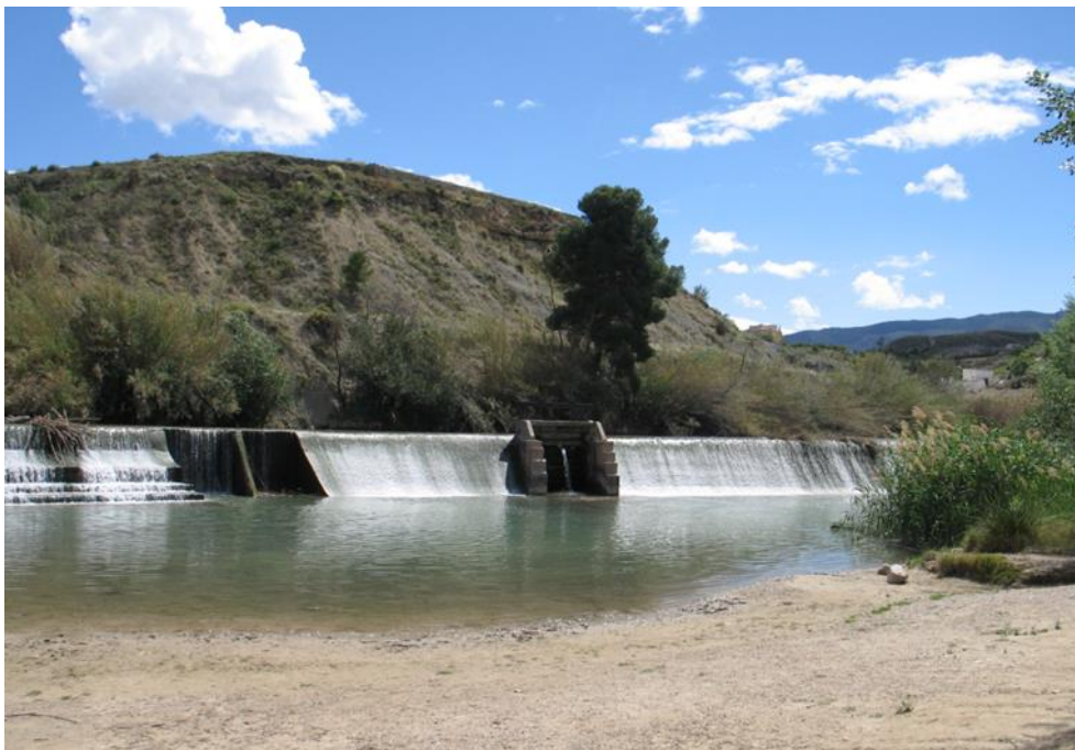
Entorno del punto de control.