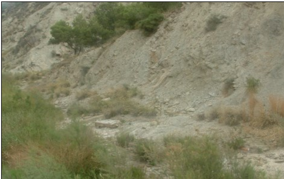
Punto de control SER2.

Observaciones: Buen acceso hasta las proximidades del punto de control. Dependiendo de las lluvias, puede haber cierta dificultad para caminar por el cauce.