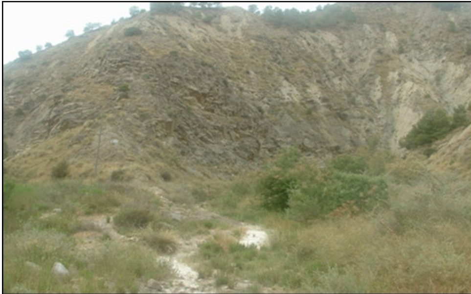
Entorno del punto de control SER2.