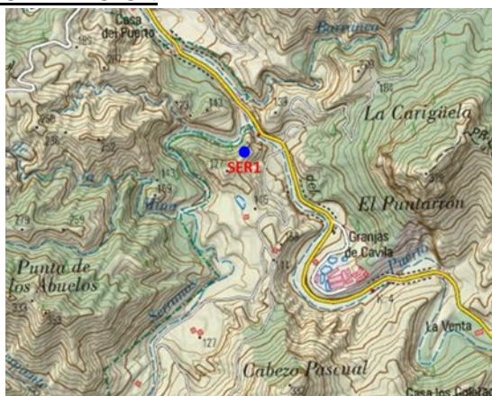
Mapa de situación