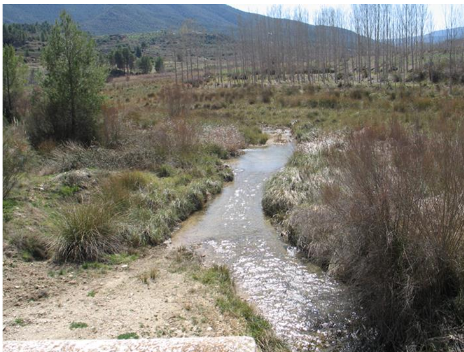
Foto del punto de muestreo

Observaciones: Buen acceso al punto de control.