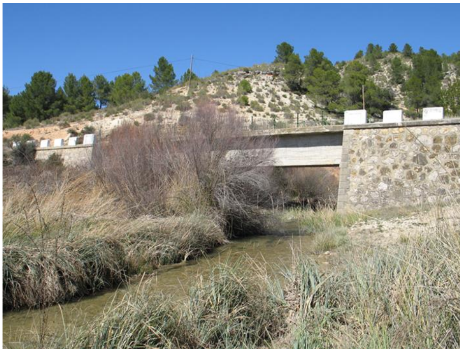
Foto del entorno