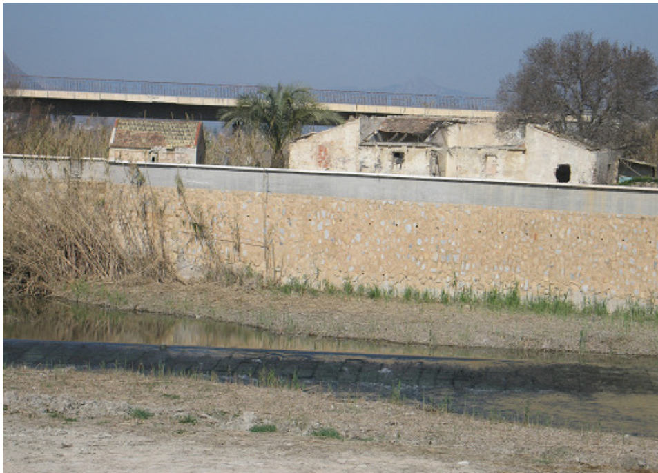
Foto del punto de muestreo

Observaciones: Acceso por la mota del río de la margen derecha.