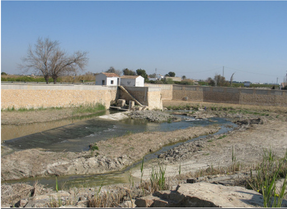
Foto del entorno