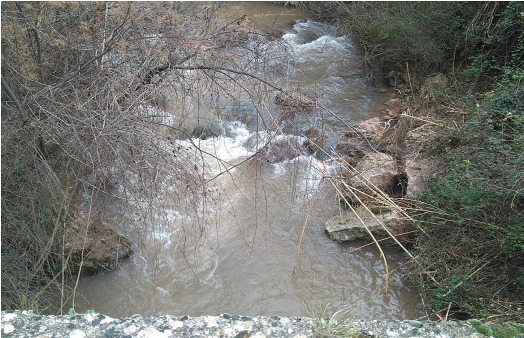
Entorno del punto de control BOG2, visto desde el puente.