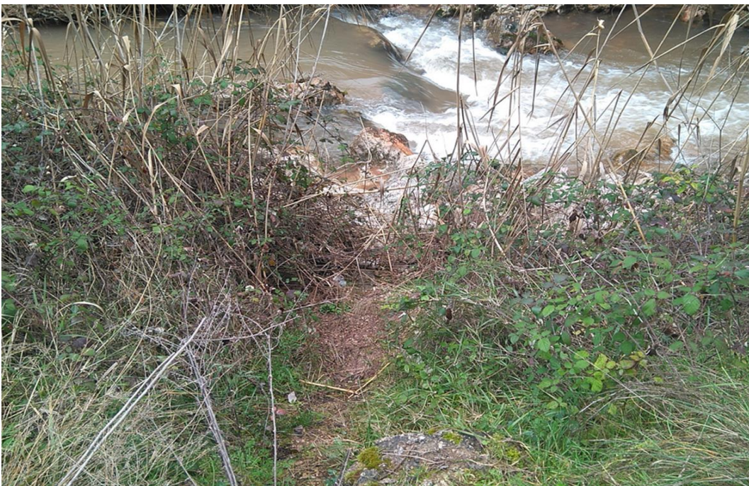
Punto de control BOG2.

Observaciones: Buen acceso al punto de control.