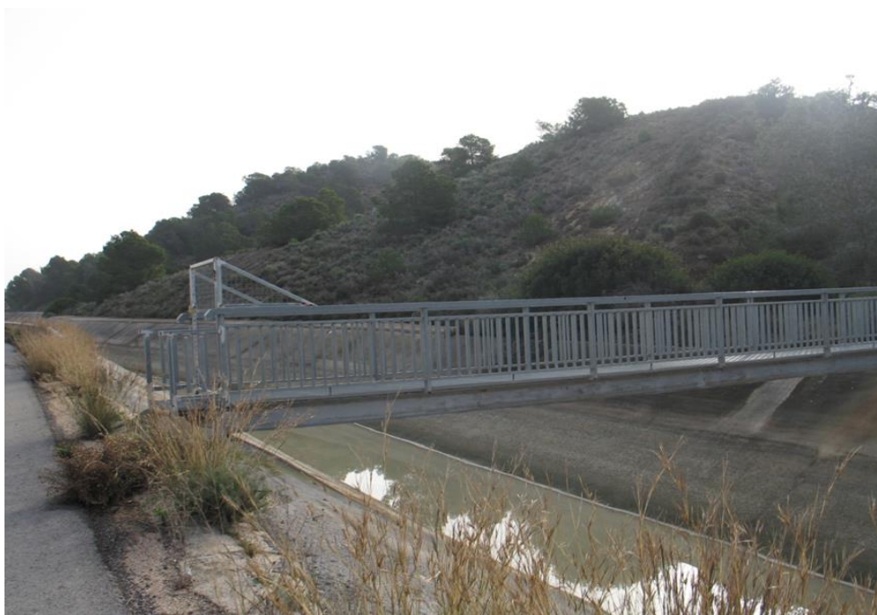
Punto de control CCC-001.

Observaciones: Hay que contactar con los operarios del embalse de La Pedrera para que faciliten el acceso.