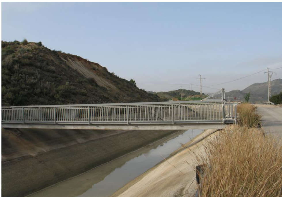
Entorno del punto de control CCC-001.