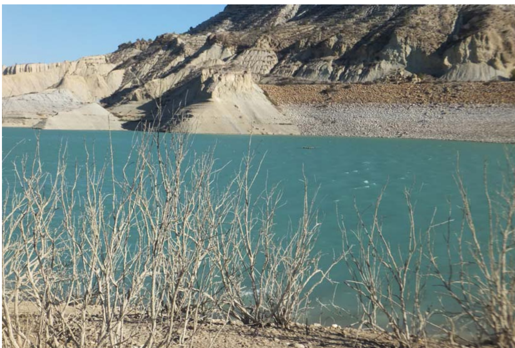
Foto del punto de muestreo