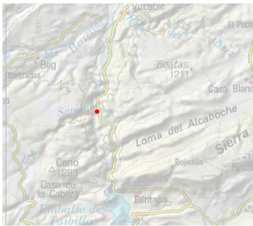
Mapa de situación