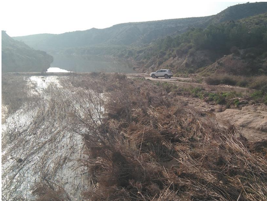
Entorno del punto de control JUD2.