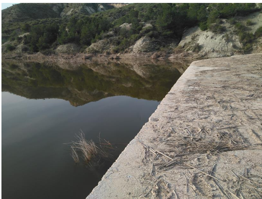
Punto de control JUD2.

Observaciones: El punto de control se encuentra en la cola del embalse del Judío. Se han corregido las coordenadas que figuraban en la base de datos, y que lo situaban en el nuevo puente que cruza la rambla.