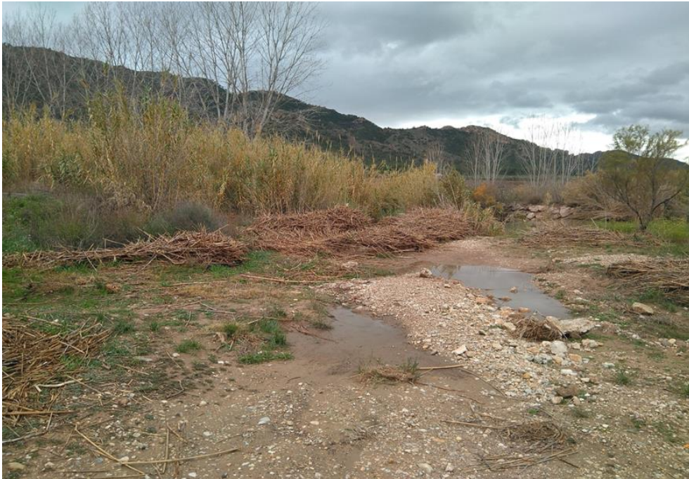
Entorno del punto de control MUN4_1.