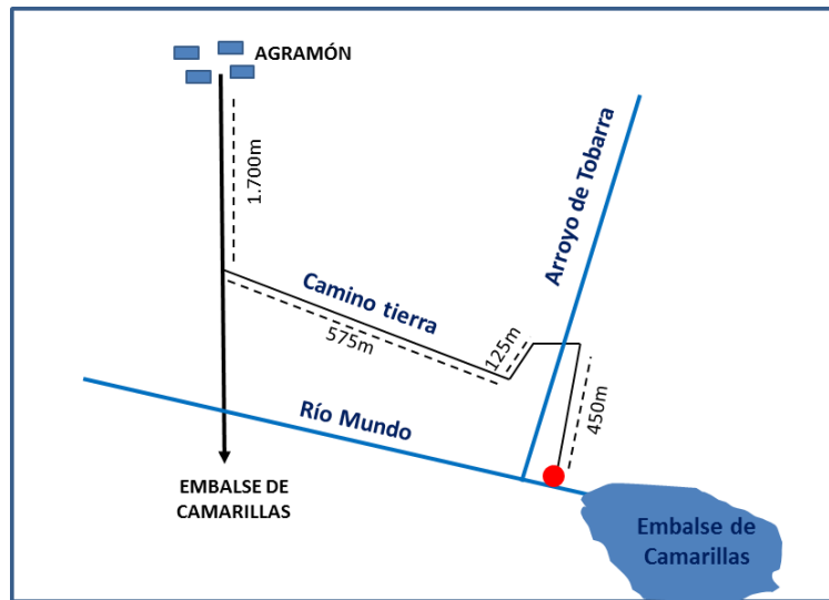
Croquis de acceso

Descripción del acceso: Salimos de Agramón hacia el embalse de Camarillas. Tras recorrer 1.500m, por la margen izquierda parte un camino de tierra en buen estado. Avanzamos otros 700m y llegamos al arroyo de Tobarra. Una vez cruzado el arroyo, tomamos el camino de la derecha. Tras recorrer otros 450m, llegamos al punto de control.