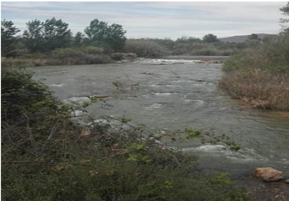
Punto de control MUN4_1.

Observaciones: Buen camino de acceso al punto de control.