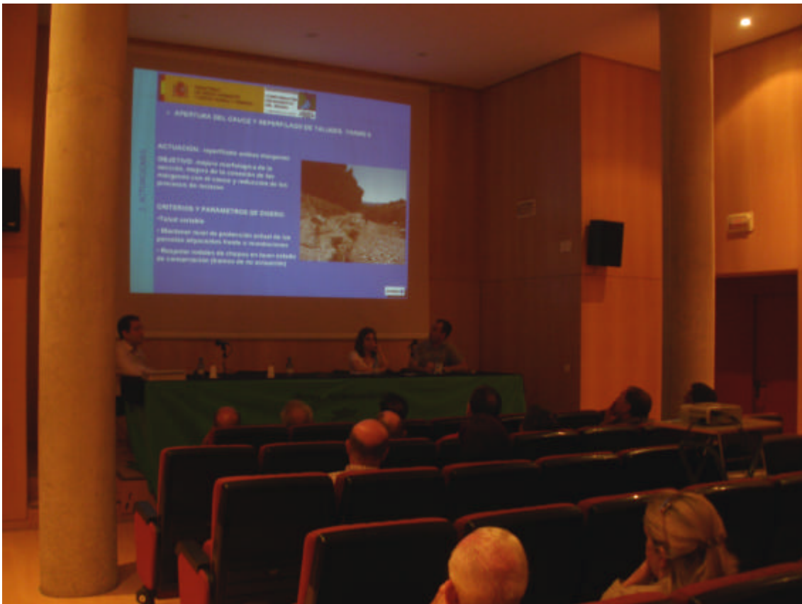
Fotografía 2. Presentación de las actuaciones del proyecto.

En esta exposición se mostraron imágenes de la situación actual y los planos de diseño de las actuaciones proyectadas, detallando de forma esquemática su contenido principal.