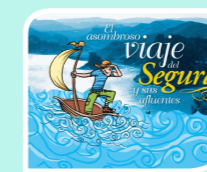
El asombroso viaje del Segura y sus afluentes

También se ponen a disposición de los visitantes de la Casa del Agua distintos materiales de divulgación acerca del agua y de la Confederación Hidrográfica del Segura, como son: