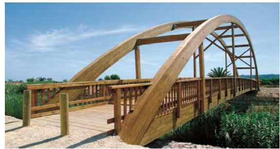
Pasarela en el Meandro de Jacarilla