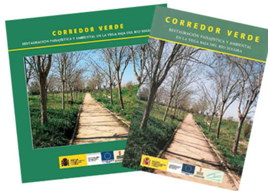
Libro y Video elaborados por la CHS para dar a conocer a la ciudadanía los trabajos ejecutados a través de Convenio

Elaboración y Edición de un libro y un video divulgativos sobre las actuaciones desarrolladas, de manera que se explicara a la ciudadanía de forma gráfica y fácilmente inteligible las labores de restauración fluvial llevadas a cabo; actuaciones en las que el beneficiario último es el ciudadano, facilitándole el disfrute de estas áreas naturales que no estaban acondicionadas; y que están encaminadas a la preservación medioambiental y acondicionamiento paisajístico de la vega baja del río Segura. El presupuesto de ambos elementos de comunicación ha resultado de 57.758,62 €, que ha asumido la CHS con fondos propios.