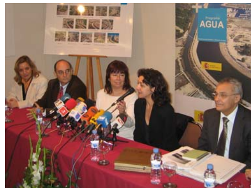
Rueda de prensa en Guardamar para presentar el proyecto (junto con la anterior Ministra de Medio Ambiente, comparecieron el Presidente de la CHS, representantes de la Generalitat Valenciana y la Alcaldesa de Guardamar en 2005)