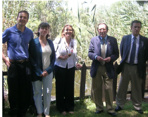
Los miembros de la Comisión de Seguimiento del Convenio, en una reunión celebrada en Valencia.