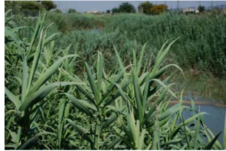
Aspecto del Río Segura a su paso por la Vega Baja tras la ejecución de las obras del Corredor Verde

Con la finalidad de proteger y regenerar el medio natural en el entorno del río Segura, y de establecer un corredor verde para articular la red de espacios naturales de la Comarca de la Vega Baja, la Confederación Hidrográfica del Segura y la actual