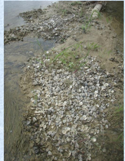
Acumulación de conchas de C. fluminea