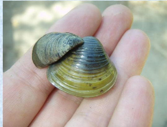
Almeja asiática junto a mejillón cebra