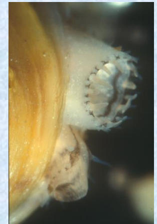
Sifones de C. fluminea

Almeja asiática ( Corbicula fluminea ). Biología, ecología y lucha contra esta EEI