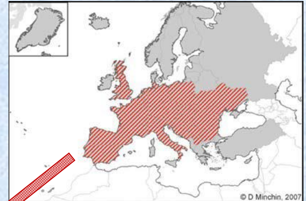
Distribución de C. fluminea en Europa

Demarcación Hidrográfica de Galicia-Costa