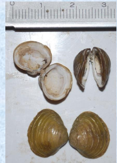
Medición de almeja asiática