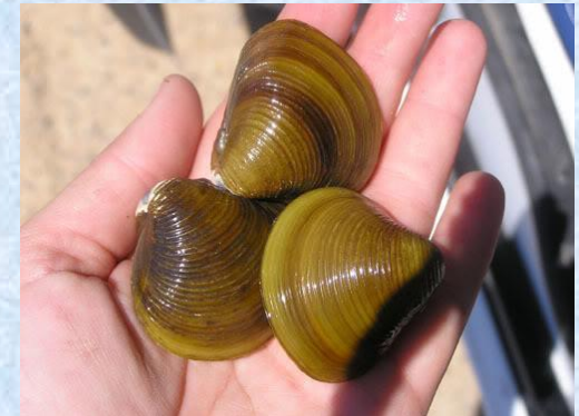
Ejemplares de gran tamaño, en el Ebro