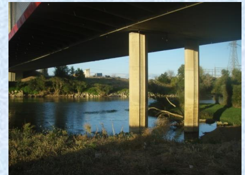
Hábitat de C. fluminea en el Ebro