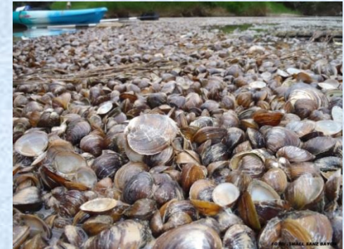
Sedimentación de conchas de C. fluminea