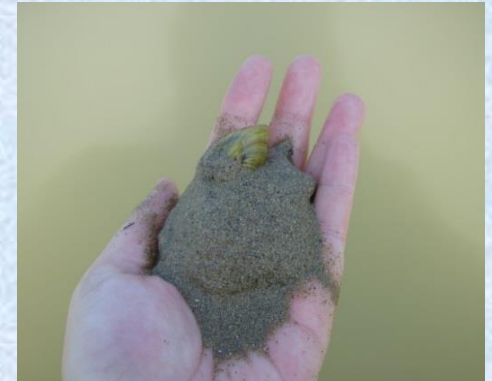
C. fluminea en su sustrato en el Ebro