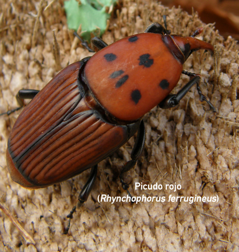
Picudo rojo ( Rhynchophorus ferrugineus )