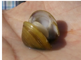
Almeja asiática ( Corbicula fluminea )