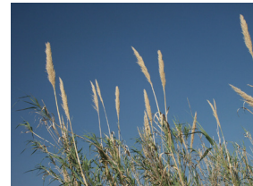
Caña ( Arundo donax )