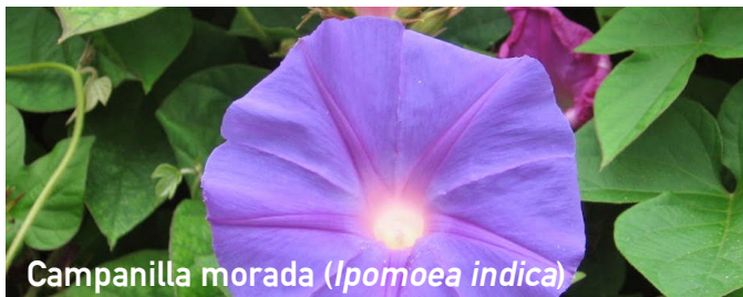
Campanilla morada ( Ipomoea indica )