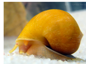
Caracol manzana* ( Ampullariidae )