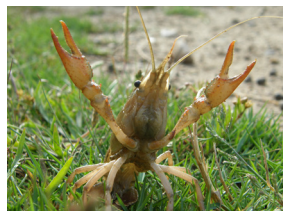
Cangrejo americano ( Procambarus clarkii )