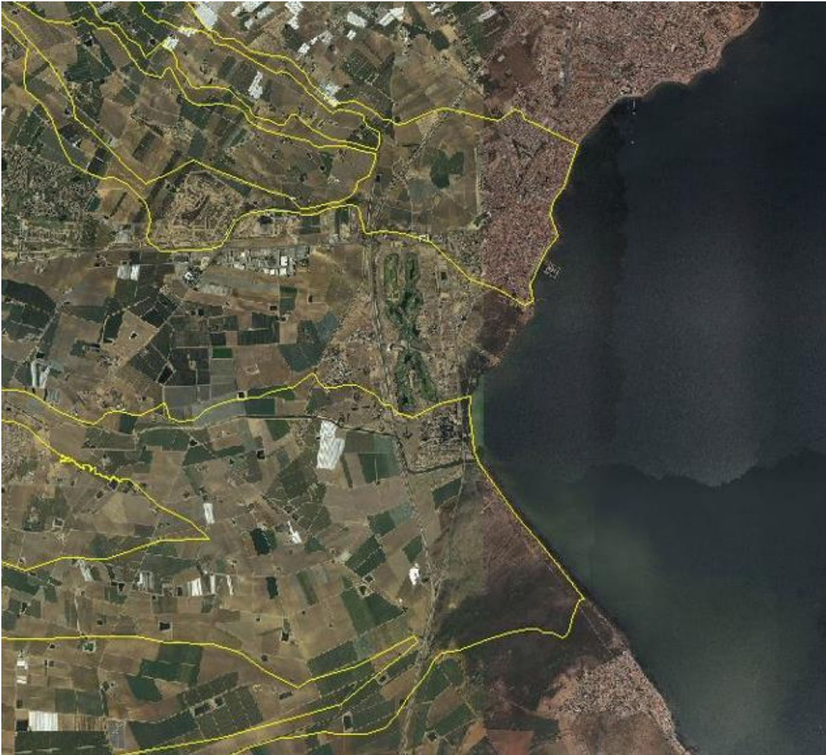
FIGURA 5. Zonas de flujo preferente de las ramblas de la Maraña y el Albujón. Lomas de Rame no tiene afección de la rambla de la Maraña y apenas de la del Albujón.