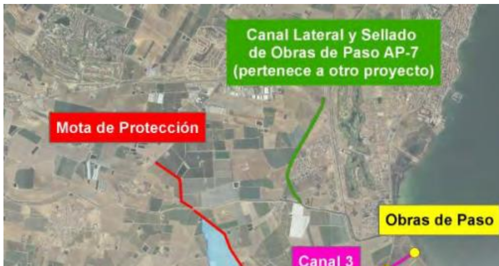
FIGURA 2. Detalle de la alternativa para la rambla del Albuñón en el PGRI.

que todo el caudal aguas arriba de la misma descienda hasta la rambla y no se produzcan inundaciones dentro en la zona de Bahía Bella.”