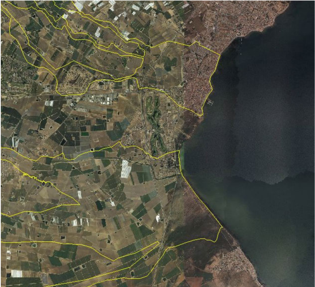
FIGURA 5. Zonas de flujo preferente de las ramblas de la Maraña y el Albuñón. Lomas de Rame no tiene afección de la rambla de la Maraña y apenas de la del Albuñón.

Esto ha hecho que la población de Las Lomas del Rame alarmada por las consecuencias que pudieran derivar de tales actuaciones se movilizan en contra de las mismas.