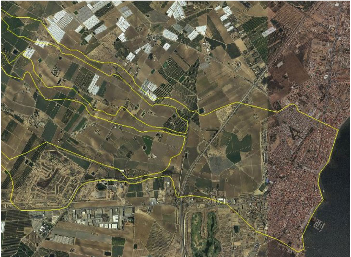
FIGURA 4. Detalle de ZFP de Maraña sin incluir flujos desbordados de La Colonia en Los Alcázares.