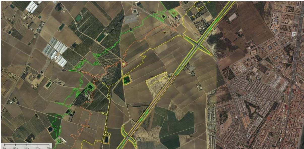
FIGURA 3. Líneas de nivel a cota 13, 14 y 15 metros

En este mismo sentido la “mota” que intercepta los flujos desbordados en la zona de flujo preferente de La Maraña ha de tener una longitud superior a 2000 metros en sentido transversal a esta misma zona de flujo preferente y a la cota 15 m como se comentaba. El volumen de agua que va a generar este embolsamiento ha de ser muy importante y la afección aguas arriba, simplemente por la topografía del terreno, va a causar perjuicios llegando incluso al municipio de Torre-Pacheco. Además, como se comenta, no hace sino trasladar el problema a Lomas de Rame, Torre de Rame, Bahía Bella y demás zonas aledañas.