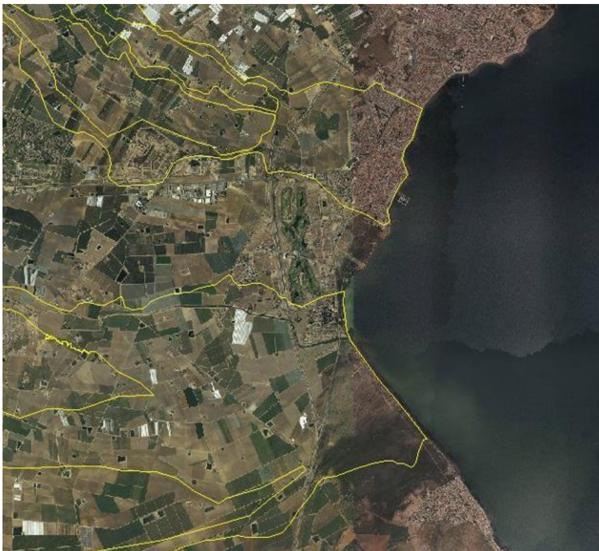
FIGURA 5. Zonas de flujo preferente de las ramblas de la Maraña y el Albuñón. Lomas de Rame no tiene afección de la rambla de la Maraña y apenas de la del Albuñón.

Esto ha hecho que la población de Las Lomas del Rame alarmada por las consecuencias que pudieran derivar de tales actuaciones se movilizen en contra de las mismas.