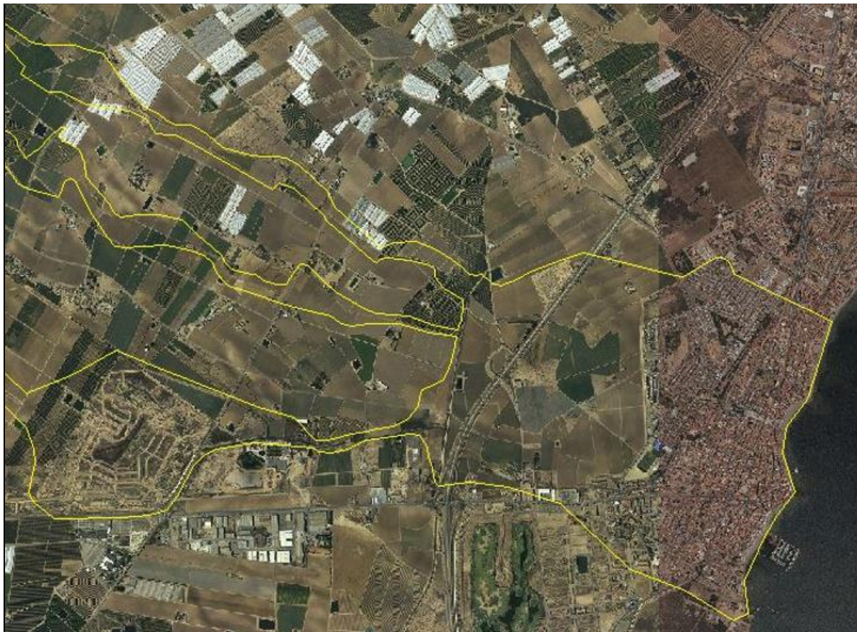
FIGURA 4. Detalle de ZFP de Maraña sin incluir flujos desbordados de La Colonia en Los Alcázares.

del Albuñón, la configuración del trazado de la AP-7 y la propia configuración topográfica de la zona generarían a esta solución.