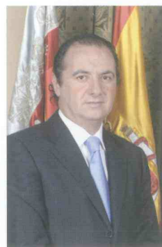
José Joaquín Ripoll Serrano Presidente de la Diputación Provincial de Alicante

Espero que la publicación contribuya a una cada vez mejor gestión del agua y del territorio, lo que debe traducirse en una mayor disponibilidad de recursos renovables y por consiguiente, en una garantía para el desarrollo sostenible de las actividades humanas en la Provincia.