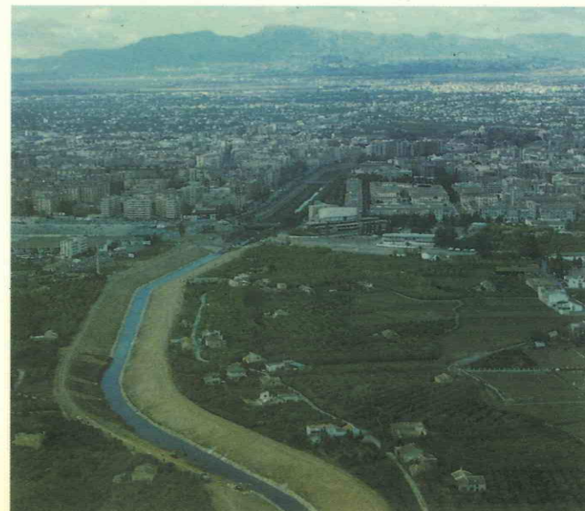
Aguas abajo Murcia capital