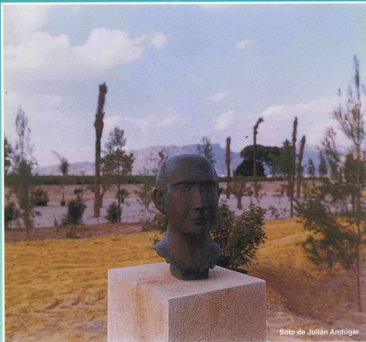
Soto de Julián Andúgar

Dirección General de Obras Hidráulicas Confederación Hidrográfica del Segura