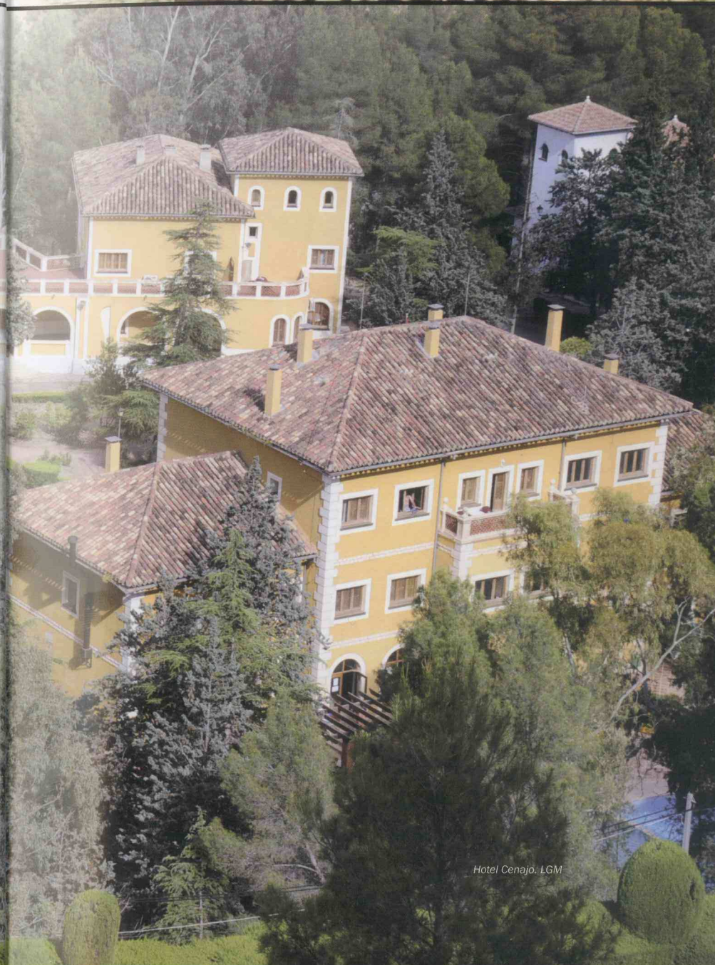
Hotel Cenajo. LGM