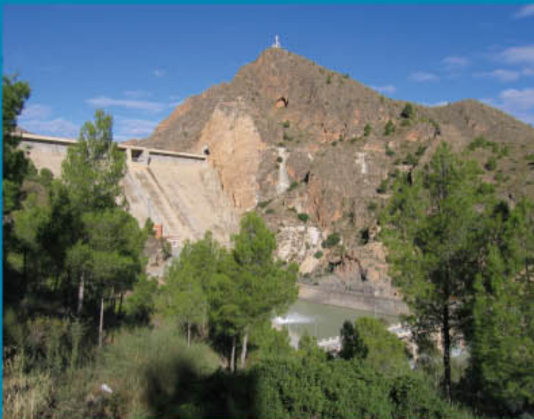
Presa del Cenajo

que riegan gran parte de la huerta de Murcia. Posteriormente, en el siglo XVI, se construyó la acequia de Churra la Nueva, también por el Norte de la ciudad de Murcia. Todavía hoy podemos ver algunas norias más en Alcantarilla y La Ñora . Así el río atraviesa la ciudad de Murcia , recibe las aguas del río Guadalentín canalizadas por El Reguerón y pasa por las poblaciones huertanas de Beniel y Orihuela . En un entorno de salinas pasa por Rojales antes de formar las Dunas de Guardamar en su desembocadura. Se trata de un campo de dunas que se extiende a lo largo de 11 kilómetros. A su lado hay una masa forestal de pinos y palmeras datileras, plantados en su momento para frenar el avance de la arena. Según las últimas investigaciones arqueológicas este paraje esconde tapados por la arena los restos de una de las más importantes ciudades fenicias del Mediterráneo y sobre ella varias mezquitas árabes.