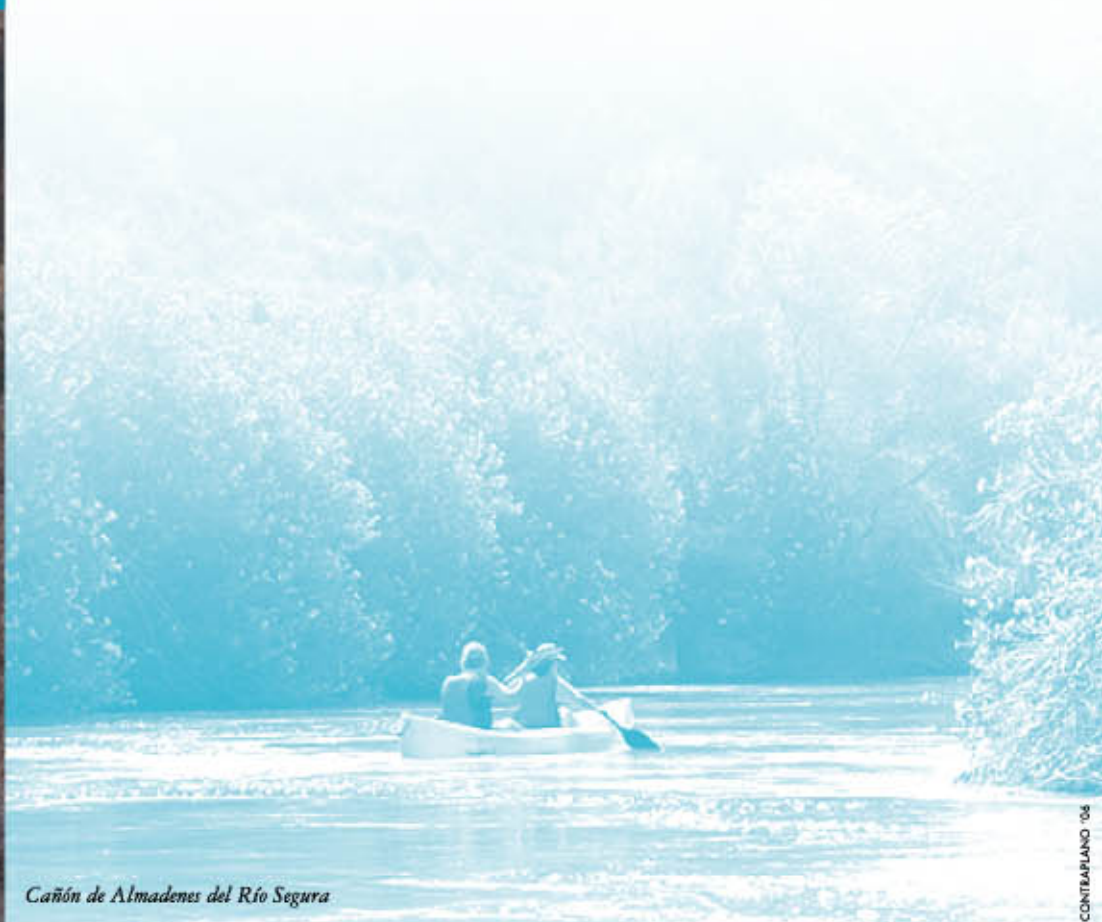
Cañón de Almadenes del Río Segura