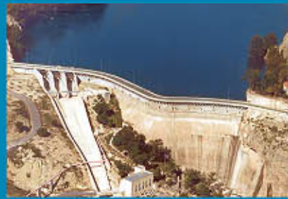
Dam de la Cruz

El río nace en la Sierra de Segura , en la provincia de Jaén a 1.413 metros sobre el nivel del mar, a unos 5 Km. de la localidad de Pontones . El Segura transcurre por un territorio en general bastante montañoso, rebasando con frecuencia los mil metros. Estos picos se alternan con valles, depresiones y llanuras. A lo largo del recorrido del río nos encontramos con tres gigantes que superan los 2.000 metros: La Sierra de las Cabras (2.081 m) en la provincia de Albacete, Cerro Poyo (2.045 m) en la Sierra de María al norte de la provincia de Almería y Navacerrada (2.014 m) situado en la Sierra Seca dentro del término municipal de Moratalla (Región de Murcia). En el límite de las provincias de Murcia y Albacete recibe las aguas del río Mundo y a la altura de Calasparrá recibe a su afluente el río Moratalla y el río Argos . En esta zona se encuentra el paraje natural del Cañón de Almedanos ,