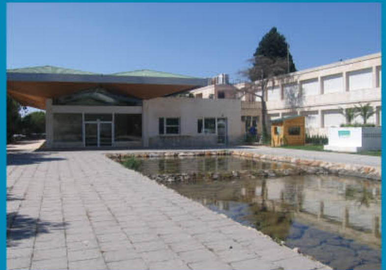
Casa del Agua

En Abarán encontramos cuatro norias, entre ellas la mayor de Europa en diámetro, conocida como Noria Grande, actualmente en funcionamiento. Cuando el río atraviesa Blanca llega al Azud de Ojós . La palabra azud viene del árabe y significa presa. El de Ojós fue construido en 1978 en el Estrecho de Solvente, para derivar las aguas del Trasvase Tajo-Segura. Por la izquierda hacia Alicante y Cartagena y por su derecha a Lorca y Almería. Se encuentra rodeado por un paraje de gran belleza e interés ambiental en el que se encuentran las poblaciones de Ulea y Archena . Posteriormente el río atraviesa las poblaciones de Ceuti , Lorquí , Alguazas y Molina de Segura , recibiendo las aguas del río Mula antes de encontrarse con otro azud: La Contraparada . Este azud data del siglo X. Situado en Javalí Nuevo (Murcia), de él parten las acequias mayores de Aljufía o Mayor (por el Norte) y Alquibla o Barreras (por el Sur),