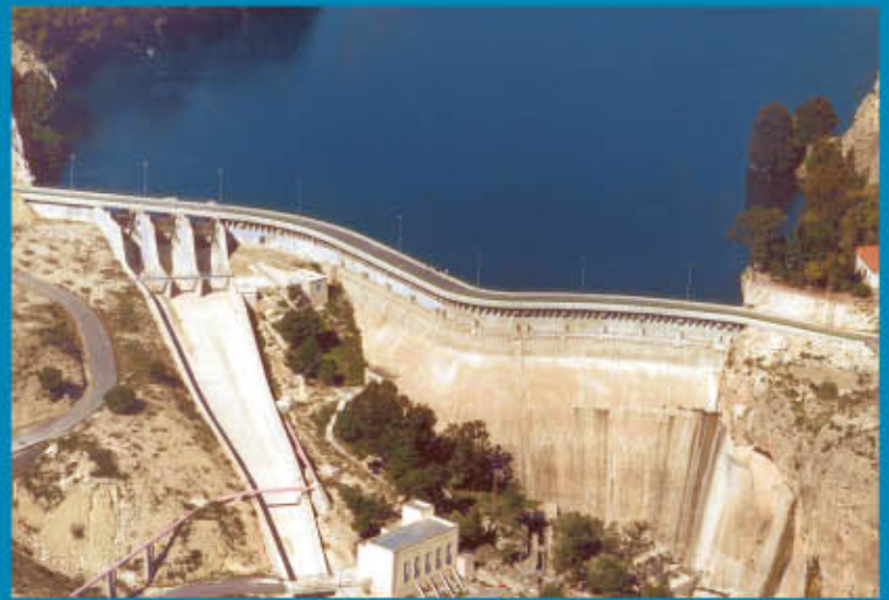
Embalse de la Cierva

El río nace en la Sierra de Segura , en la provincia de Jaén a 1.413 metros sobre el nivel del mar, a unos 5 Km. de la localidad de Pontones . El Segura transcurre por un territorio en general bastante montañoso, rebasando con frecuencia los mil metros. Estos picos se alternan con valles, depresiones y llanuras. A lo largo del recorrido del río nos encontramos con tres gigantes que superan los 2.000 metros: La Sierra de las Cabras (2.081 m) en la provincia de Albacete, Cerro Poyo (2.045 m) en la Sierra de María al norte de la provincia de Almería y Revolcadores (2.014 m) situado en la Sierra Seca dentro del término municipal de Moratalla (Región de Murcia). En el límite de las provincias de Murcia y Albacete recibe las aguas del río Mundo y a la altura de Calasparra recibe a su afluente el río Moratalla y el río Argos . En esta zona se encuentra el paraje natural del Cañón de Almadenes ,