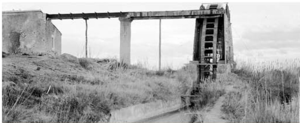
Noria Vega Alta

http://publicaciones.administracion.es Número NIPO: 320-06-001-0