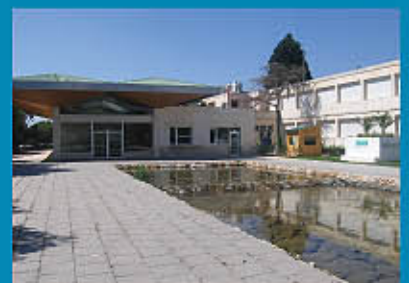
Casa del Agua

En Abarán encontramos cuatro norias, entre ellas la mayor de Europa en diámetro, conocida como Noria Grande , actualmente en funcionamiento. Cuando el río atraviesa Blanca llega al Azud de Ojós . La palabra azud viene del árabe y significa presa. El de Ojós fue construido en 1978 en el Estrecho de Solvante, para derivar las aguas del Trasvase Tajo-Segura. Por la izquierda hacia Alicante y Cartagena y por su derecha a Lorca y Almería. Se encuentra rodeado por un paraje de gran belleza e interés ambiental en el que se encuentran las poblaciones de Ulea y Archena . Posteriormente el río atraviesa las poblaciones de Cauti , Lorquí , Alguazas y Molina de Segura , recibiendo las aguas del río Mula antes de encontrarse con otro azud: La Contrapareda . Este azud data del siglo X. Situado en Javalí Nuevo (Murcia), de él parten las acequias mayores de Aljifla o Mayor (por el Norte) y Alquibla o Barreras (por el Sur),