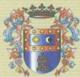
Ayuntamiento de Moratalla

Han colaborado en la elaboración de este libro