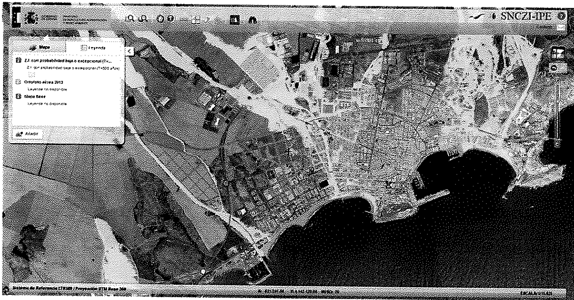
Áreas inundables de origen fluvial para T=500 años.