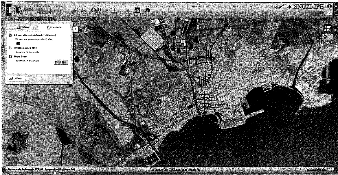
Áreas inundables de origen fluvial para T=10 años.