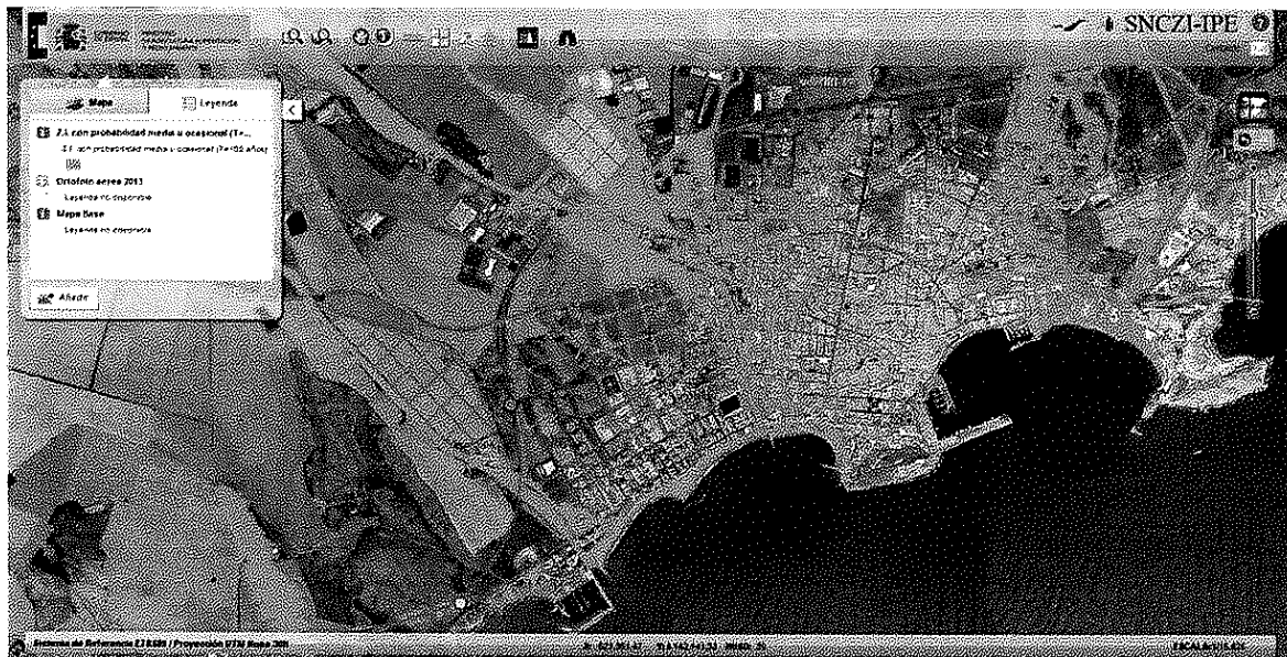
Áreas inundables de origen fluvial para T=100 años.