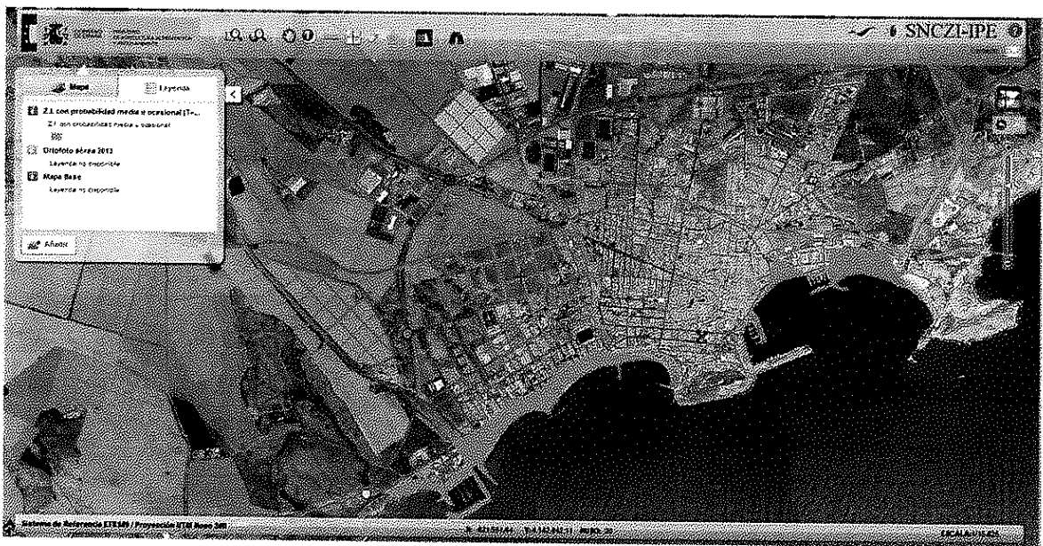
Áreas inundables de origen marino para T=100 años.