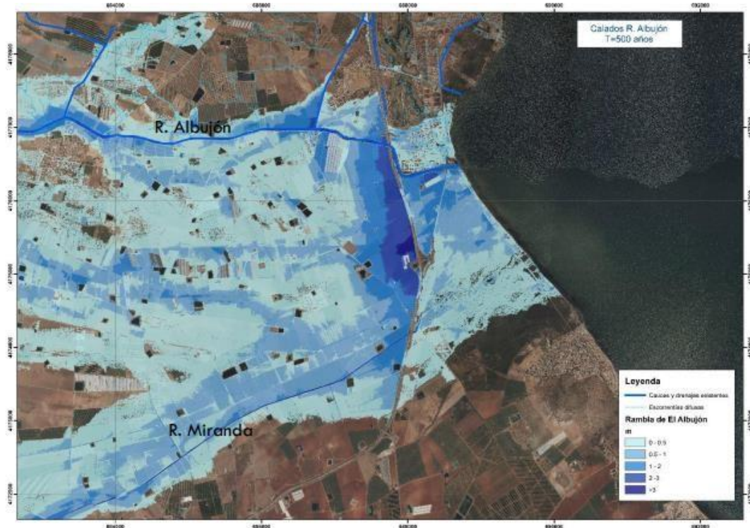
Figura 3-13. Plano de calados para la Rambla de El Albuñón y la Rambla de Miranda. SNCZI

AUMENTAR LA CAPACIDAD HIDRÁULICA DEL DRENAJE AGRÍCOLA D-7 DEL CAMPO DE CARTAGENA. REPOSICIÓN DE SERVICIOS DE LA OBRA DE DRENAJE TRANSVERSAL BAJO LA CARRETERA RM F30. T.M LOS ALCÁZARES (MURCIA) como se refiere en el siguiente extracto: