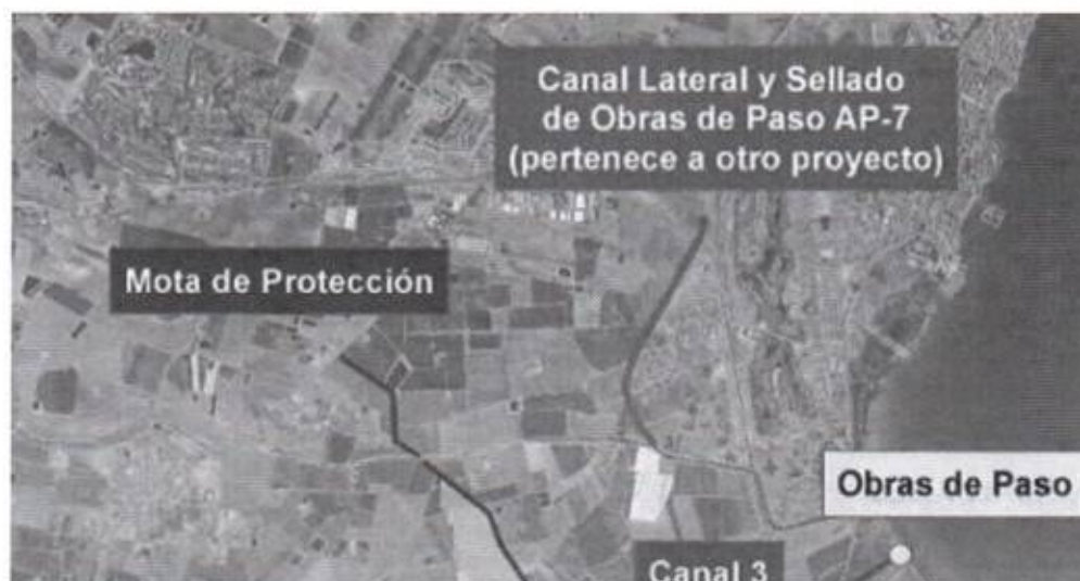
FIGURA 2. Detalle de la alternativa para la rambla del Albuñón en el PGRI.

que todo el caudal aguas arriba de la misma descienda hasta la rambla y no se produzcan inundaciones dentro en la zona de Bahía Bella.”