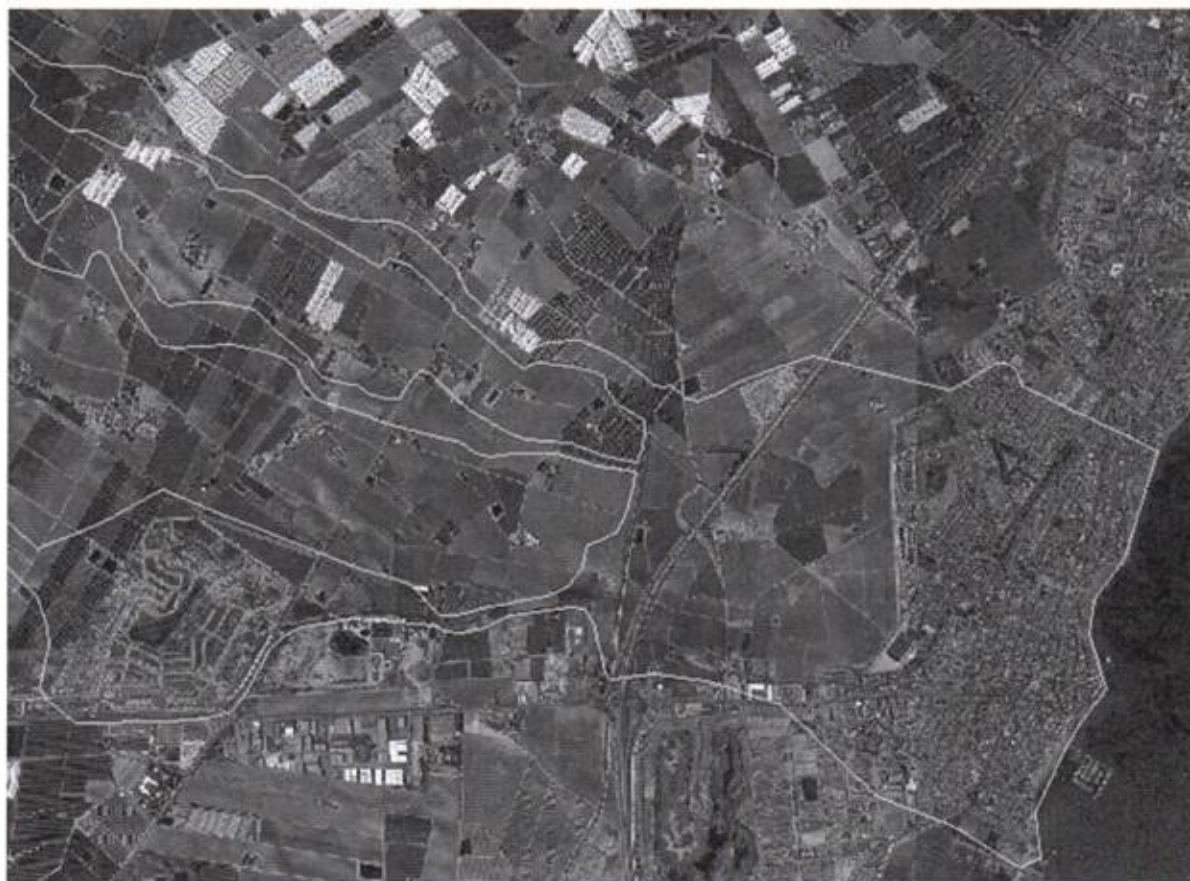
FIGURA 4. Detalle de ZFP de Maraña sin incluir flujos desbordados de La Colonia en Los Alcázares.

De esta cita cabe deducir que el planteamiento que presenta la propia CHS de la medida 1895 del PdM no ha sido suficientemente estudiado dada la situación que el propio encauzamiento del Albuñón, la configuración del trazado de la AP-7 y la propia configuración topográfica de la zona generarían a esta solución.