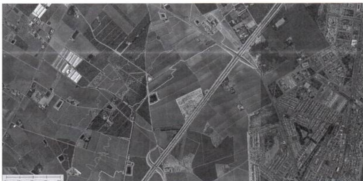
FIGURA 3. Líneas de nivel a cota 13, 14 y 15 metros

En la Memoria del PROYECTO PARA AUMENTAR LA CAPACIDAD HIDRÁULICA DEL DRENAJE AGRÍCOLA D-7 DEL CAMPO DE CARTAGENA. CANALIZACIÓN DE ESCORRENTÍAS EN LA AVENIDA FERNANDO MUÑOZ ZAMBUDIO Y ALEDAÑOS. T.M LOS ALCÁZARES (MURCIA), su punto 3.3 ESTUDIO DE SOLUCIONES cita literalmente: