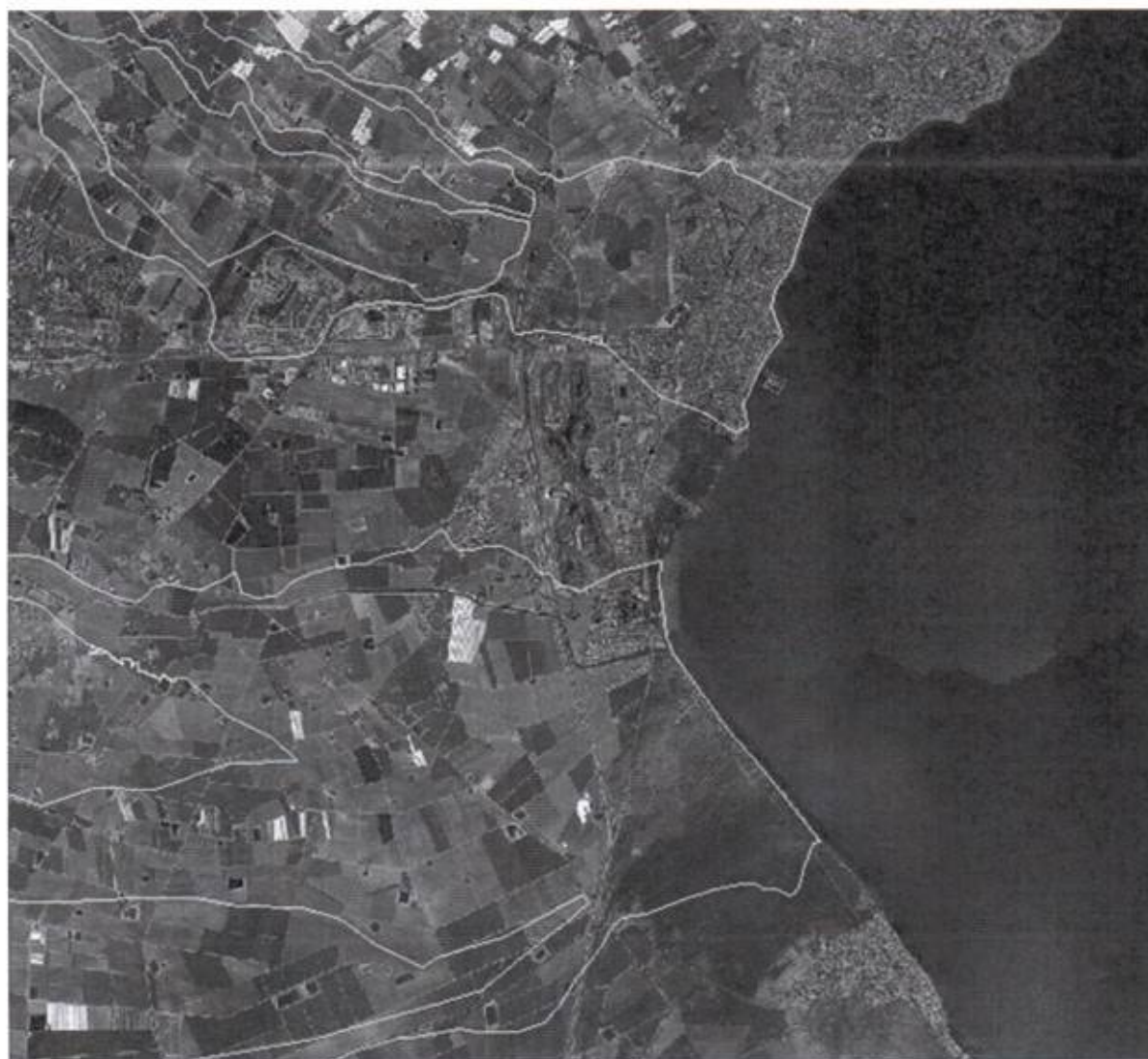
FIGURA 5. Zonas de flujo preferente de las ramblas de la Maraña y el Albuñón. Lomas de Rame no tiene afección de la rambla de la Maraña y apenas de la del Albuñón.