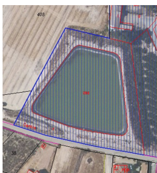
Balsa en parcela 30002A02000031