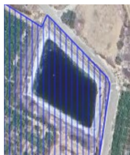
Balsa en parcela 30002A01800083